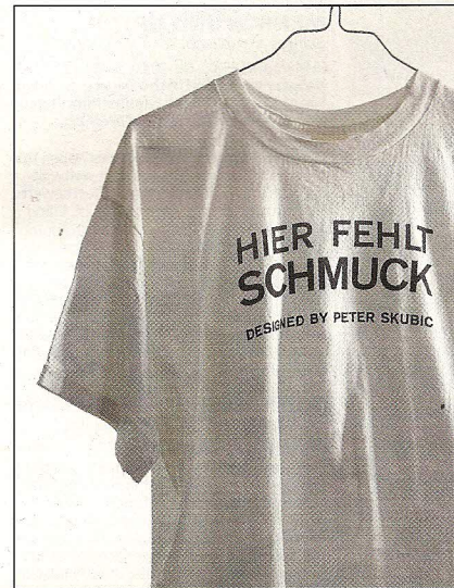
Revolutionärer Aufbruch: RADIKAL

Alljährlich gibt die Internationale Handwerksmesse , IHM, in der Neuen Messe Riem den Anlass für ein geballtes Stelldichein lokaler und internationaler Schmuck-Begeisterter. Für Sammler ist dieser Großauftritt ein Muss, für Macher ein Eldorado und für Neugierige die feinste Gele-