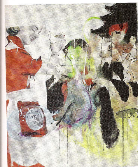
Endy Hupperich: Heidi, Peter, Nußkuchen, 2010. Foto: Künstler

Ab 11. November zeigt Endy Hupperich in aktuellen Arbeiten „Coole Nerds“ der global-metrosexuellen Werbekampagnen, comicartige Westernhelden mexikanischen Ursprungs und alte Klassiker aus Kinder- tagen wie Heidi und Peter. Dabei treten die Figuren aus einer flächigen, mal in pastel- ligen, mal in knalligen Tönen, collagierten Malerei hervor und verweisen auf filmi- sche Sehgewohnheiten und Elemente der urban art. Die Ausstellung des Titels „Finger an die Ecke ...“ zeigt einen Über- blick seines zeichnerischen und maleri-